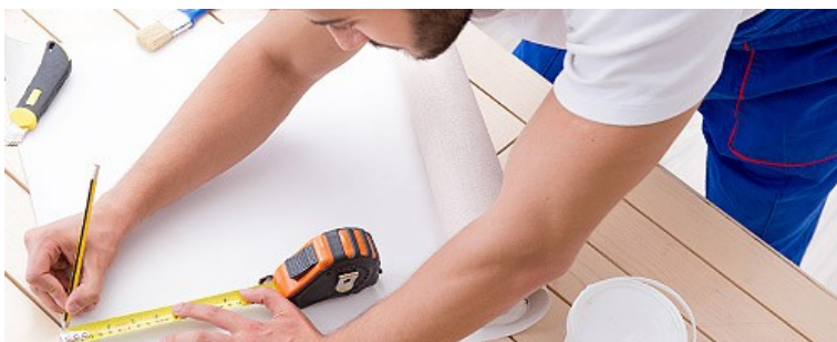
Строительные работы и ремонт помещений

Налог на профессиональный доход можно платить и при осуществлении других видов деятельности, если соблюдаются все условия, предусмотренные Федеральным законом № 422-ФЗ.