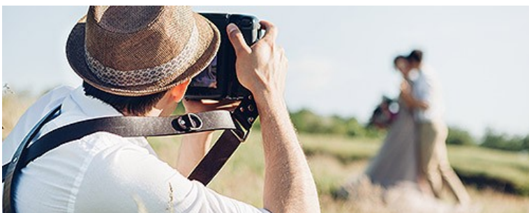
Фото- и видеосъемка на заказ