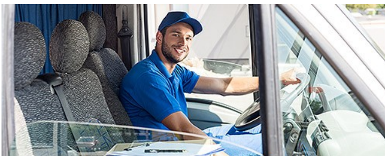
Услуги по перевозке пассажиров и грузов