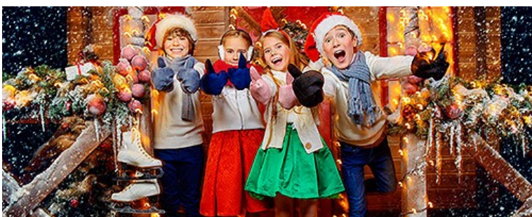
Проведение мероприятий и праздников