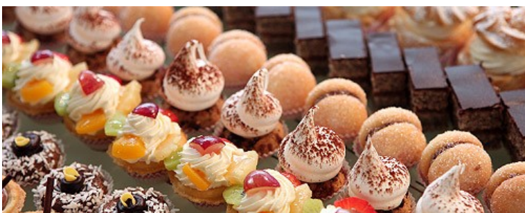
Продажа продукции собственного производства