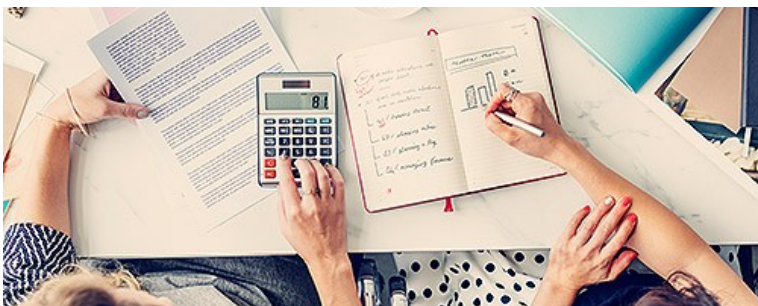
Юридические консультации и ведение бухгалтерии